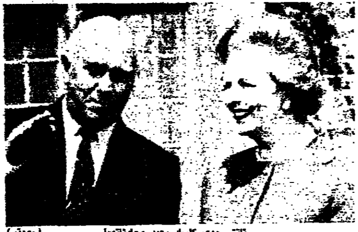
ناتشر ودي كليك بعد محادثتهما